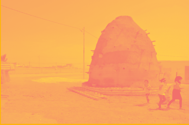
Emergency Architecture & Human Rights (EAHR): The classroom for refugee children, Za'atari Village, Jordan, 2017; Photo: Martina De Rutino