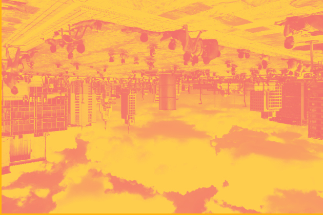
Paulo Mendes da Rocha und MMBB Architekt*innen: SESC 24 Maio, Sao Paulo, Brasilien, 2017; Foto: Ana Mello