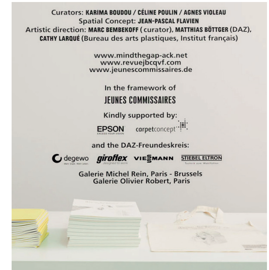
Beispiel, Logodarstellung im Ausstellungsbereich DAZ

Wir freuen uns auf die Zusammenarbeit und darauf gemeinsam eine besondere und erfolgreiche Partnerschaft zu gestalten.