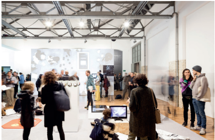
Ausstellung „A SPACE IS A SPACE IS A SPACE“ in Kooperation mit dem Institut français