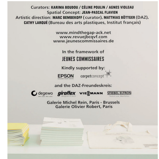
Beispiel, Logodarstellung im Ausstellungsbereich DAZ

Wir freuen uns auf die Zusammenarbeit und darauf gemeinsam eine besondere und erfolgreiche Partnerschaft zu gestalten.