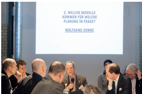
Diskussionsrunde „Städtebau – Eine Debatte über die Stadtgestaltung und das Berufsbild“

Welche Themen bestimmen die Architektur? Welche Strömungen und Ansätze gibt es?