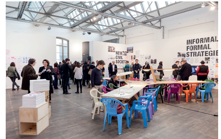
Wanderausstellung „WELTSTADT - wer macht die Stadt?“ mit Unterstützung des Goethe Instituts