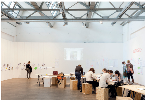
Workshop „Wonderlab Berlin – Urbanität fördern“