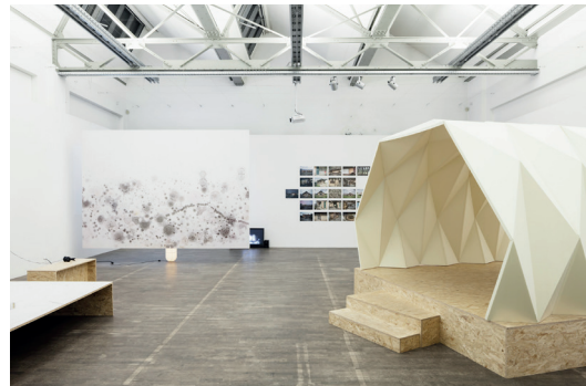
Ausstellung „Neue Bescheidenheit – Architektur in Zeiten der Verknappung“