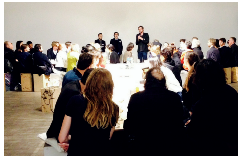
Veranstaltungsreihe „In Extenso“, Y-Table-Dinner mit geladenen Gästen