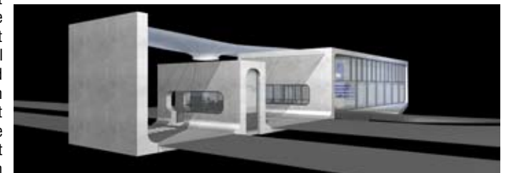
Pfote Solar Valley, Rendering

Wir finden es schwierig, wenn nicht gar unmöglich, Menschen, die wir nicht persönlich kennen, zum Vorbild zu nehmen. Uns inspirieren die