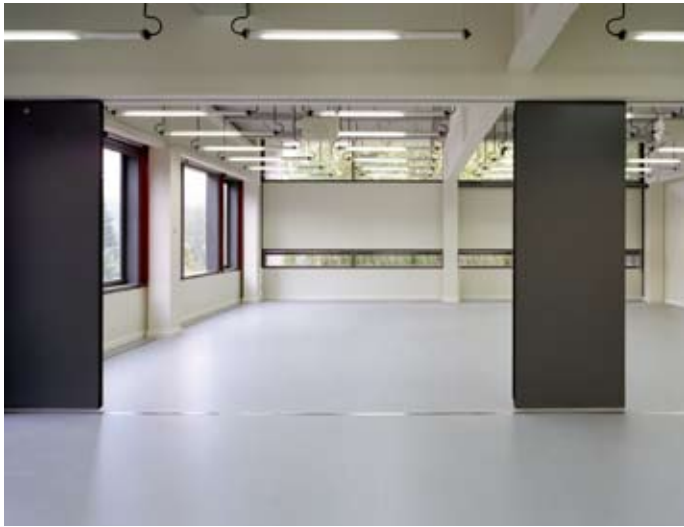
Campus-Center Breitenbrunn, Innenraum