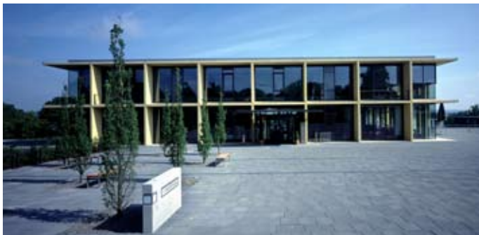
Ostdeutsche Sparkassenakademie Lichtenwalde

Erweiterungsbau des Instituts für Produktionstechnik, Zwickau, 2008 Sanierung einer Wohnstätte für Menschen mit Behinderung, Leipzig, 2008 Neubau einer Wohnstätte für Menschen mit Behinderung, Leipzig, 2007 Neubau "Historische Fahrzeuge", Zwickau, 2007 Riesentropenhalle Gondwanaland, Leipzig, 2006 Neubau Heinrich-Böll-Stiftung, Berlin, 2005 Universität und Pädagogische Hochschule, Luzern (CH), 2005 Topographie des Terrors, Berlin, 2005 Museumshöfe, Berlin, 2005 Neues Musiktheater, Linz (A), 2005 Aarebrücke, Olten (CH), 2005 Erweiterung Oberstufenzentrum Mühlizelg, Abtwil (CH), 2005 Bundesverwaltungsgericht, St. Gallen (CH), 2005 "Garten für Verliebte", Meran (I), 2005 Franz -Liszt - Konzertsaal, Raiding (A), 2004 Olympic Landmark, Paris (F), 2004 Fußgängersteig über die Limmat, Baden (CH), 2004 Gemeindezentrum, Taufkirchen (A), 2004 Das Königliche Theater, Kopenhagen (DK), 2002 Deutsche Botschaft, Warschau (PL), 2002 BMW Niederlassung, Leipzig, 1997