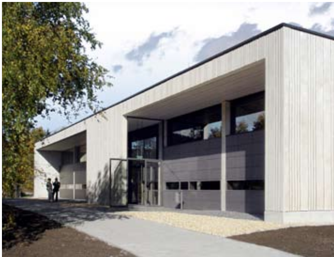
Campus-Center Breitenbrunn, Eingang