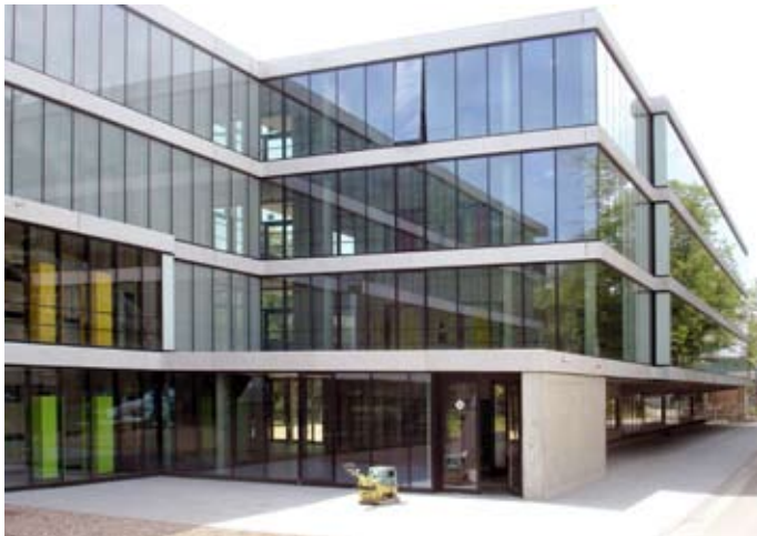
Blindenschule Chemnitz, Eingang