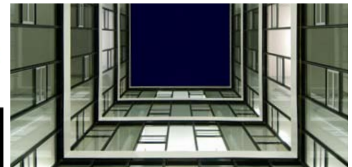
Q.Cells Büroneubau OF1, Lichthof