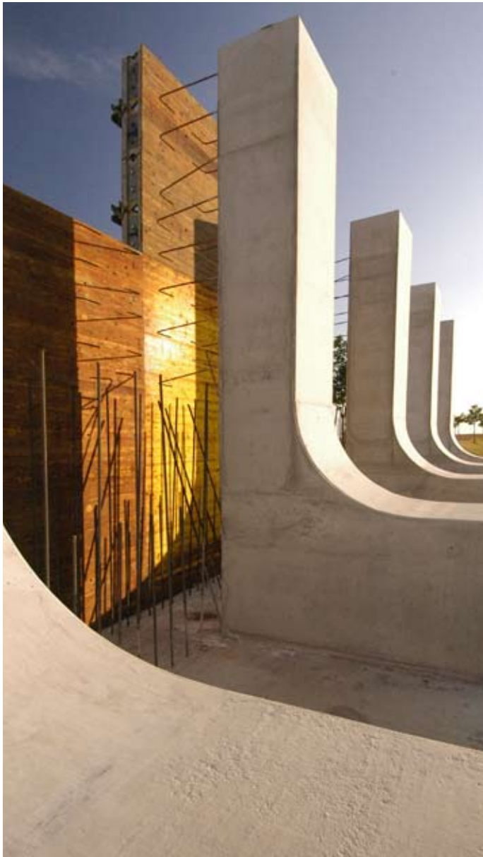
Pfote Solar Valley, Rohbau