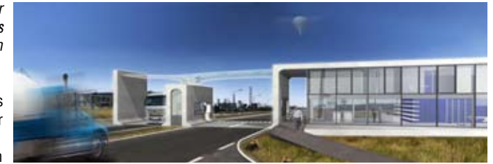
Pfote Solar Valley, Rendering

Ob das Solar Valley uns für die Zukunft verändert, können wir nicht einschätzen. Aber im Moment ist es für uns eine neue und extreme Erfahrung. Unser Büroleben war die letzten Jahre schon sehr geordnet – 30-50 Prozent des Büros machte Wettbewerbe und der andere Teil baute die meist aus Wettbewerben hervorgegangenen Projekte und dies in wechselnden Konstellationen. Seit zwei Jahren werden nur noch die notwendigsten, eingeladenen Wettbewerbe bearbeitet. 80 Prozent unserer Bürokapazitäten sind nun auf Solar Valley konzentriert – eine andere Form von architektonischer Monokultur, auch wenn wir dort neben Industriehallen und Büros für 1000 Leute auch Bushaltestellen