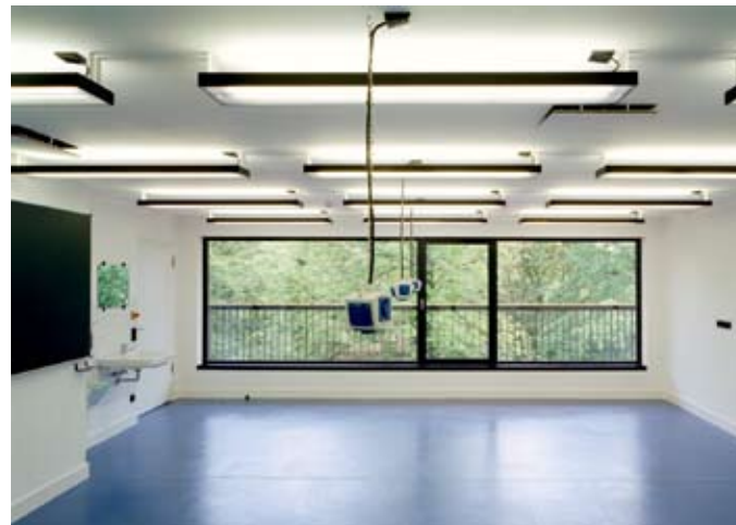
Blindenschule Chemnitz, Innenraum

> Was regt euch auf? Die so genannte „Monokultur“ habt ihr ja schon genannt. Gibt es weitere Tendenzen oder Entwicklungen in der Architektur bzw. Baukultur, an denen ihr euch reibt, die ihr besonders kritisiert oder für bedenklich haltet?