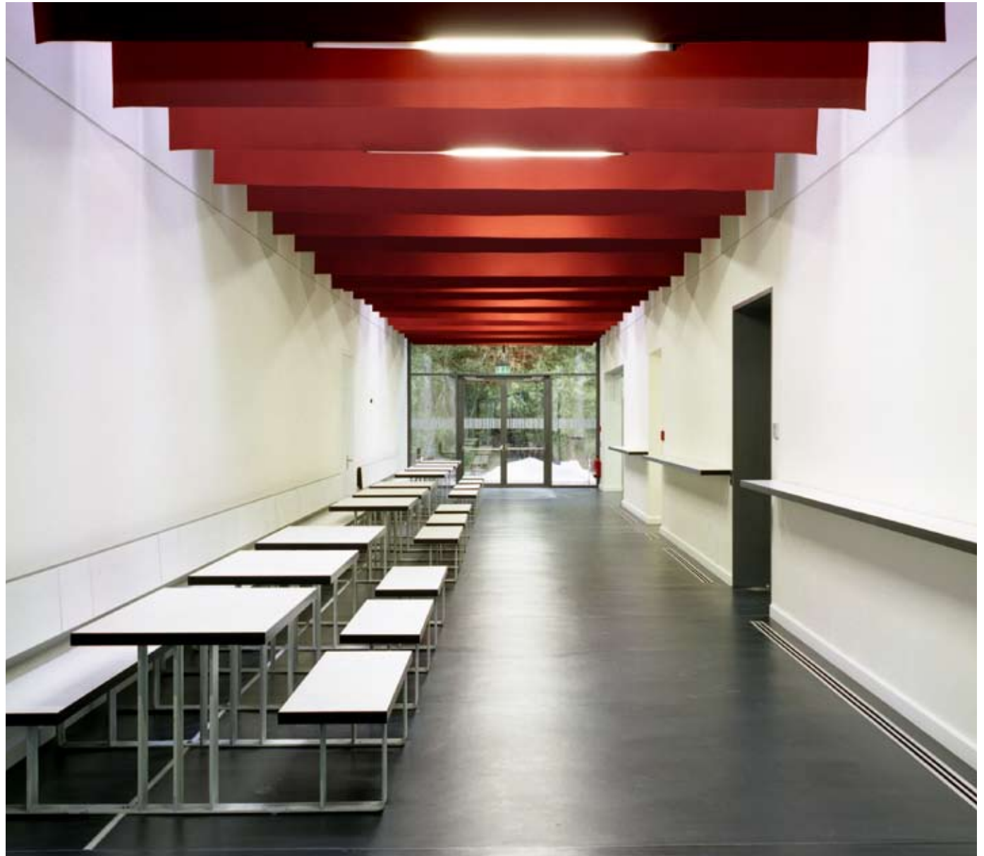
Campus-Center Breitenbrunn, Mensa