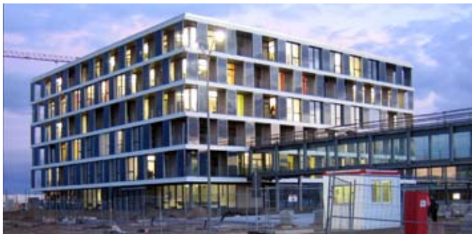
Q.Cells Büroneubau OF1

Rudolfsschule, Chemnitz, 2007 - 2010 Produktionserweiterung CALYXO B1-B2, Solar Valley, 2007 - 2009 Produktionserweiterung CALYXO L1P, Solar Valley, 2006 - 2008 Pforte Solar Valley, Solar Valley, 2006 - 2008 Bus-Station, Solar Valley, 2007 - 2008 Finanzamt - Sanierung Leihhaus, Leipzig, 2006 - 2008 Finanzamt - Archivanbau, Leipzig, 2006 - 2008 Heim Kirschberg, Leipzig, 2001 - 2007 Stadthäuser, Leipzig, 2006 - 2007 Campus-Center, Breitenbrunn, 2001 - 2007 Sächsische Blindenschule, Chemnitz, 2004 - 2007 Q.Cells Büroneubau OF1, Solar Valley, 2006 - 2007 Sächsisches Rehasentrum für blinde und sehbehinderte Kinder und Jugendliche, Chemnitz, 2004 - 2007 Umgestaltung des Telekom Tagungshotels, Leipzig, 2006 Neugestaltung des Thomaskirchhofs, Leipzig, 2000 - 2006 Sozialpädagogisches Zentrum - Frühförderstelle, Leipzig, 1999 - 2005 Volks- und Raiffeisenbank Muldental, Grimma, 2003 - 2004 Rathaus, Haldensleben, 1997 - 2002 Flughafen Leipzig/Halle - Bürogebäude Süd, Schkeuditz, 2000 - 2002 Ostdeutsche Sparkassenakademie, Lichtenwalde, 1997 - 2001 Hauptniederlassung ENVIA, Leipzig, 1996 - 2000 Berufsschulzentrum 5, Leipzig, 1996 - 1999 Internat, Borna, 1997 - 1998