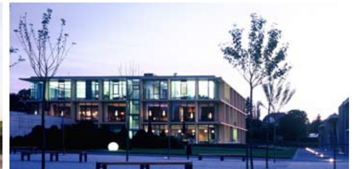
Ostdeutsche Sparkassenakademie Lichtenwalde