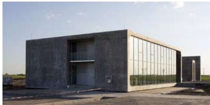
Pforte Solar Valley