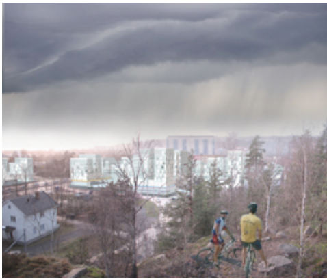
Rendering Cumulus, 2008