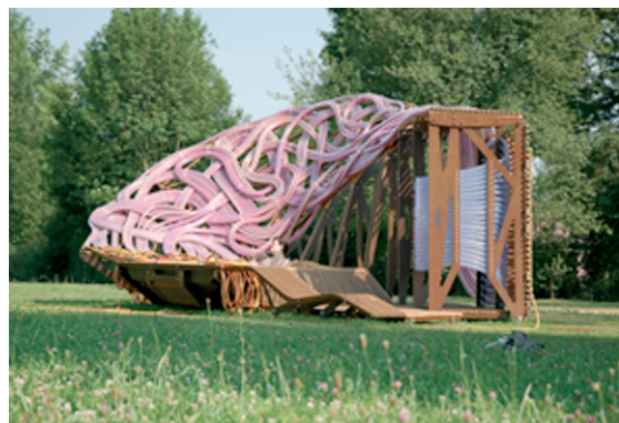
Bad, Schlosspark Solitude Stuttgart, 2006

Der Wettbewerbsentwurf „Cumulus“, der jetzt realisiert werden soll, ist exemplarisch für die stark kontextbezogene Arbeitsweise von SMAQ: Der Entwurf für ein Zentrum in einem Osloer Wohnviertel der 70er Jahre verbindet unterschiedliche soziale Sphären, Programme und Maßstäbe durch ein über die Jahreszeiten hinweg organisiertes Wasserrecycling. Regenwasser wird auf Dächern und Fassaden des verdichteten Wohnkomplexes gesammelt; es reflektiert Licht und Himmel in die Wohnungen und versorgt die gemeinsamen Waschküchen. Im Winter wird das Wasser freigegeben, Teile des öffentlichen Raums werden geflutet und gefrieren - die geschlossene Schlittschuhhalle, Herzstück des öffentlichen Programms, expandiert zur offenen Eislauffläche. Sie wird zum sportlichen und sozialen Treffpunkt; im Frühling fließt das Tauwasser über die angrenzenden Kleingärten zurück in den natürlichen Kreislauf.