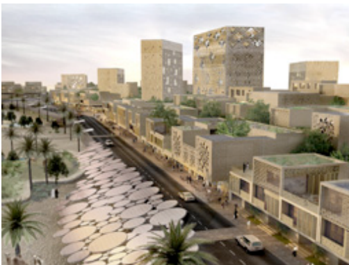
Xeritown, Dubai, 2006-07