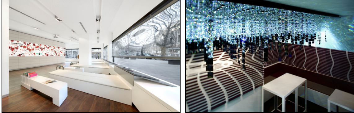
Links: Homecouture Flagshipstore, Berlin 2005 / Rechts: Microrant Cosmogrill, München 2006

Neben Take-Off haben Franken Architekten weitere Projekte für BMW entwickelt – die Inszenierung von BMW-MINI auf der Tokio Motorshow 2005 ist gerade für den Designpreis der BRD 2008 nominiert worden.