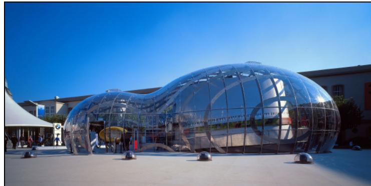
Links: BMW Take-Off, Flughafen München, 2003 / Rechts: BMW Bubble, Internationale Automobil Ausstellung, Frankfurt / Main 1999

Franken Architekten haben sich selbst ein „Mission Statement“ formuliert: „Bauen, was unvorstellbar scheint. Einen Sinn für Möglichkeiten haben. Das verborgene Potenzial in jeder Aufgabe entdecken. Unverwechselbare Lösungen umsetzen.“ Vor diesem Hintergrund entstehen ihre Unternehmensarchitekturen. Messeauftritte, Ausstellungen und Präsentationsräume, die die Architekten um Bürogründer Bernhard Franken als „Brandscapes“ bezeichnen: „Brandscapes geben der unternehmerischen Vision des Auftraggebers einen Raum – sichtbar, begehbar, mit allen Sinnen erlebbar.“ Corporate Architecture made by Franken fällt auf durch spektakuläre Außenraumskulpturen und effektvolle Innenraumerzählungen. In den vergangenen Jahren hat vor allem die Installation Take-Off, die sich durch die Eingangshalle von Terminal II im Münchner Flughafen schlängelt, Aufmerksamkeit erregt und dem Büro zahlreiche Auszeichnungen und Preise beschert. Die Form des aus 360 verschiedenen Lamellen bestehenden Bandes wurde anhand einer Simulation der Besucherströme entwickelt und eröffnet dem Reisenden im Vorübergehen wechselnde Motive.