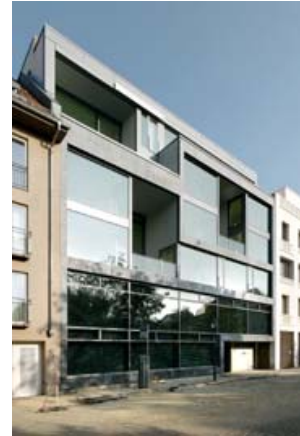
Multi-Generations Haus, Berlin (© Grüntuch Ernst Architekten)

Die Ausstellung nähert sich der komplexen Thematik auf zwei Ebenen. Einerseits werden aus jedem der untersuchten Quartiere einzelne konkrete Architekturprojekte im Detail behandelt. Diese Architekturprojekte sind: