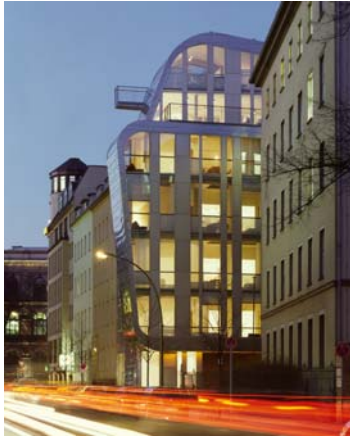
Slender / Bender, Berlin