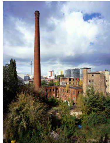
Spree-Areal, Foto: Noah Sheldon