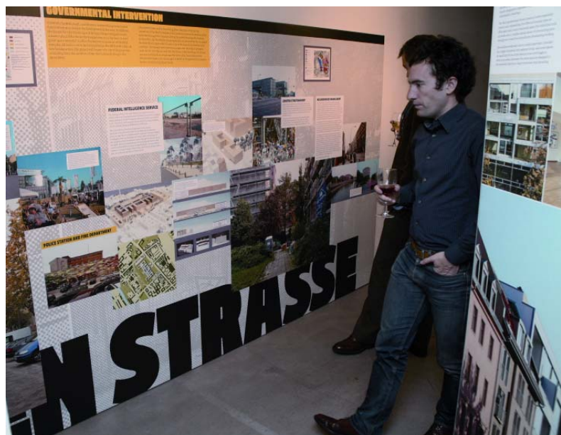
Ausstellungseröffnung im Center for Architecture, New York, November 2007