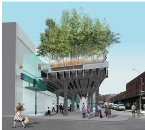
Vertical Access / Plaza on 18 th Street to Highline Park, New York (© Diller Scofidio + Renfro Architects with Field Operations)