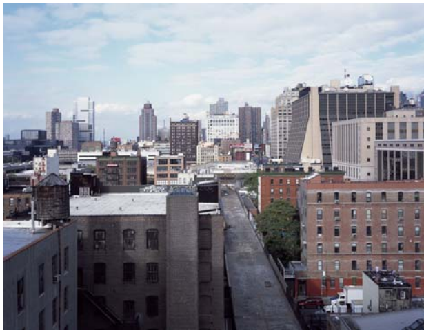
Chelsea, Foto: Noah Sheldon