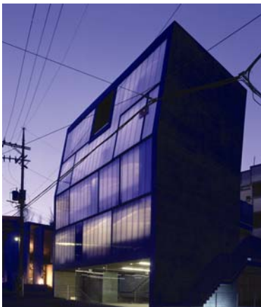
KIM In Cheurl

'Megacity Network' ermöglicht einen Querschnitt durch das Spektrum der zeitgenössischen koreanischen Architektur und zeigt ihre Zusammenhänge - ein Netzwerk in dessen Zentrum die Megacity Seoul liegt. Von dort verbreitet sich ein Großteil der Ideen, die im ganzen Land architektonische Stereotype hinterfragen und Neuerungen in Gang setzen.