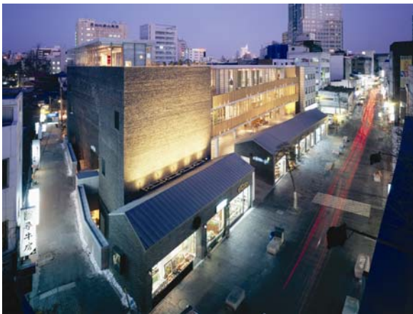
CHOI Moongyu Ssamziegil