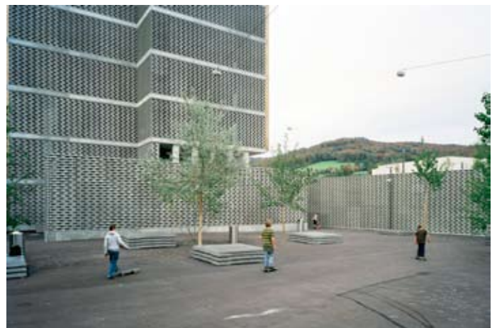
Schulhaus Bruggerstraße / Berufsbildung Baden