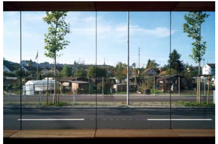
Die Glattalbahn bei Zürich