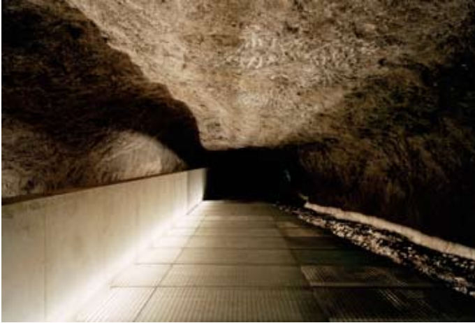
Saline von Bex (Waadt)

Folgende gewürdigte Projekte werden in der Ausstellung und einer Begleitpublikation der Schweizer Fachzeitschrift TEC21 präsentiert: