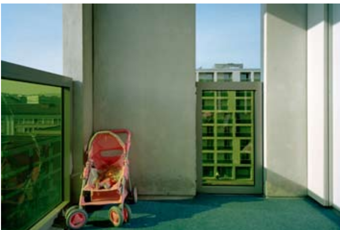
Ersatzneubau der Wohnsiedlung Werdwies (Zürich)

Das Projekt interpretiert gemeinnützigen Wohnungsbau als gesellschaftliche Aufgabe neu – als kulturellen Prozess der Stadterneuerung und als ein Versatzstück der "sozialen Stadt". Es genügt hohen Ansprüchen an Wohnqualität und Umfeld ebenso wie an effizientes und Ressourcen sparendes Bauen. Es wird ein vielfältiger sozialer, kultureller, wirtschaftlicher und ökologischer Mehrwert erzeugt.