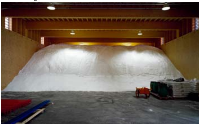
Autobahnwerkhof CeRN in Bursins (Waadt)

Der neue Autobahnwerkhof von Bursins fügt sich harmonisch in die als schützenswert erklärte Landschaft. Er vereint unter einem Dach Werkhalle, Garagen, Lager sowie nach Süden orientierte Büros. Diese verdichtete, neuartige Organisation kann als wegweisend für ähnliche Typologien betrachtet werden. Das Gebäude ist flexibel für zukünftige Anpassungen und Erweiterungen konzipiert. Durch Rückbau und Wiederverwendung des ursprünglichen Gebäudes wurde eine ausgeglichene ökologische und wirtschaftliche Bilanz erzielt.