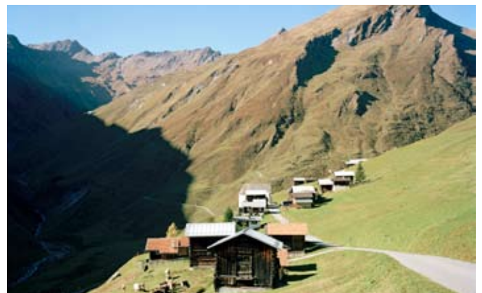
Gemeinde Vrin (Graubünden)