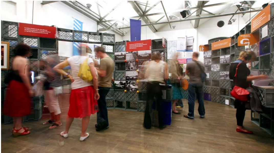
"Citámbulos" im DAZ