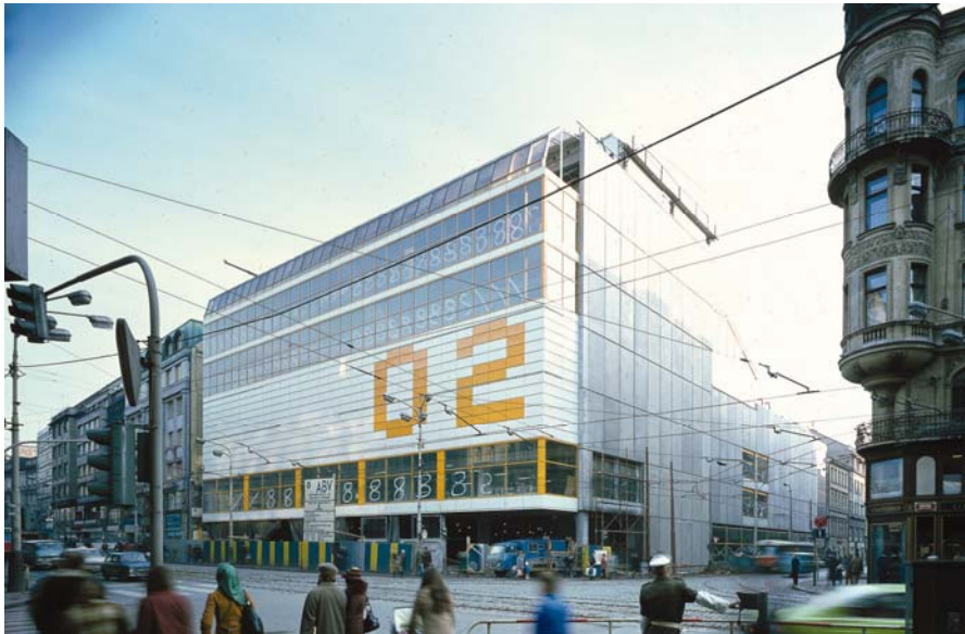
Máj Kaufhaus, Prag