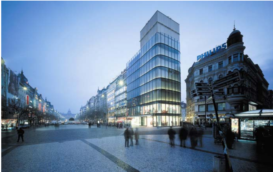
Palác Euro, Wenzelsplatz Prag