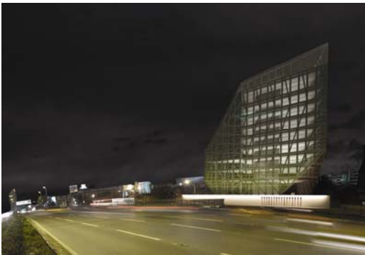
Abbildung: Can Cinici/Cinici Architecture Ltd.

Architekten: Can Cinici/ Cinici Architecture Ltd.