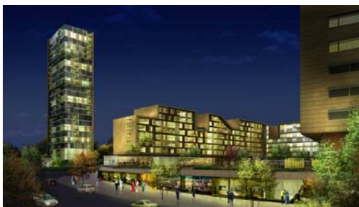
Abbildung: Emre Arolat Architekten

Projekt: Maslak Bijoux Plaza, Istanbul, Türkei, 2008 Architekten: Emre Arolat Architekten