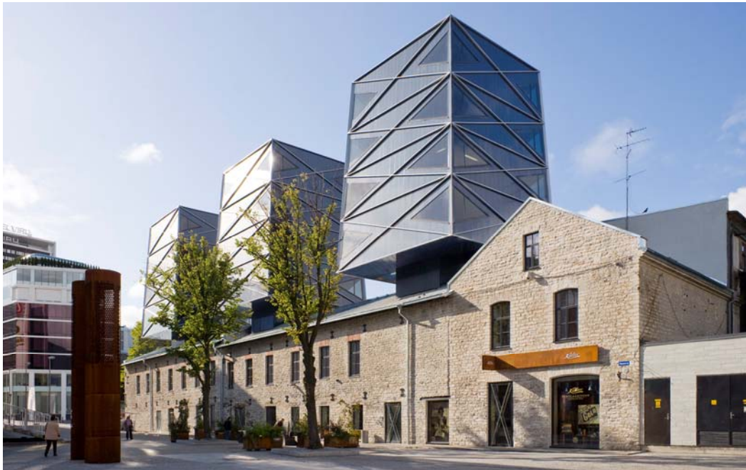
Geschäfts- und Bürogebäude im Roterhagen-Viertel, KOKO architects