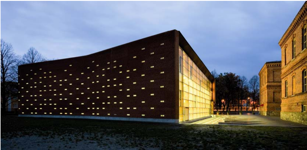
Sporthalle Pärnu Zentrum, KAVAKAVA architects, Foto: Kaido Haagen

Berlin, Mai 2010. BOOM/ROOM präsentiert herausragende Beispiele zeitgenössischer Architektur in Estland, die in besonderer Weise auf den städtebaulichen Kontext reagieren. Die Ausstellung setzt sich mit dem Bauboom in der Baltenrepublik seit Mitte der 90er Jahre auseinander.